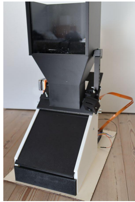
Abb. 4: fertiger Automat