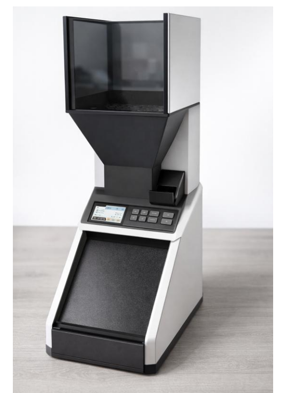
Abbildung 5: KI-generierte Visualisierung eines möglichen Seriendesigns

Die grösste Erkenntnis: Selbst eine «einfache» Idee birgt beim Umsetzen viel versteckte Komplexität von der Mechanik über die Elektronik bis zur KI.