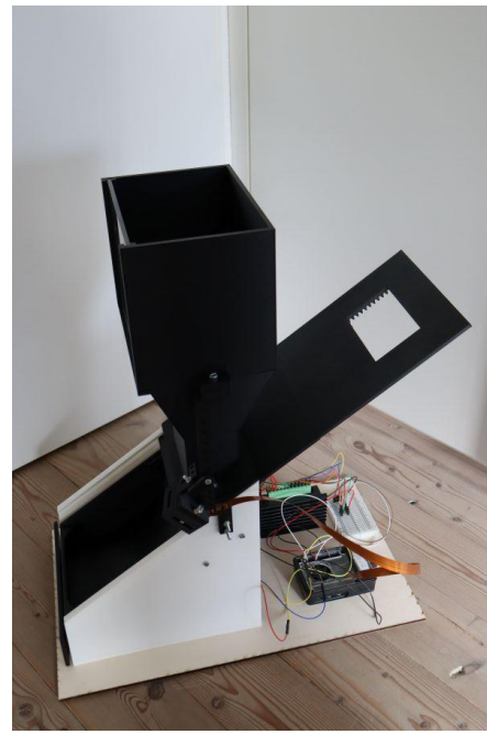
Abb. 5: fertiger Automat